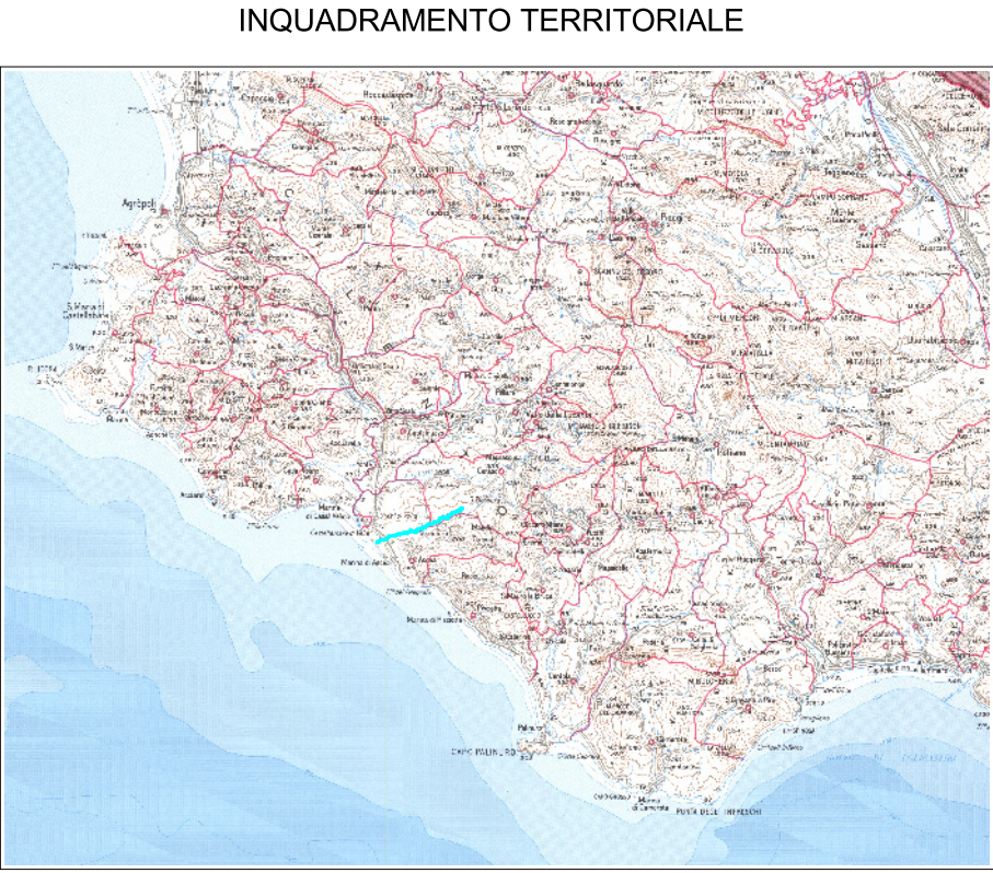
QUADRO DI UNIONE